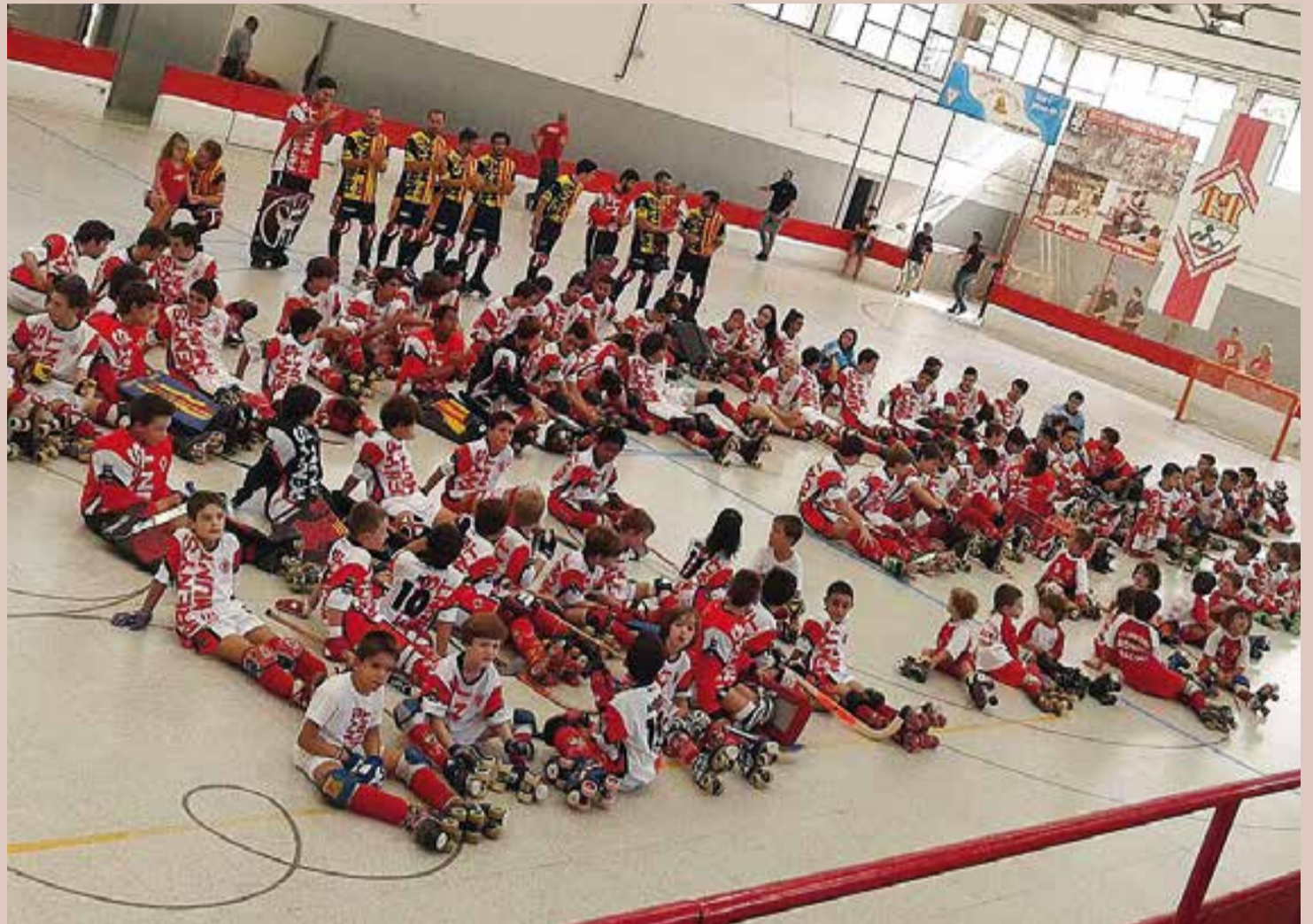
Presentació dels equips d'hoquei patins 2015-2016 amb la nova equipació de color blanc

Des dels nens i nenes de l'escola fins als jugadors del primer equip de Nacional Espanyola, sumen més de 120 jugadors que juntament amb els entrenadors i delegats van fer possible la gran foto de la temporada.