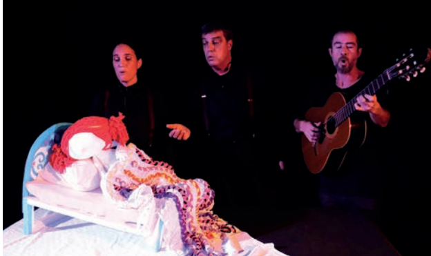
Teatre de titelles: Pauuuuuu