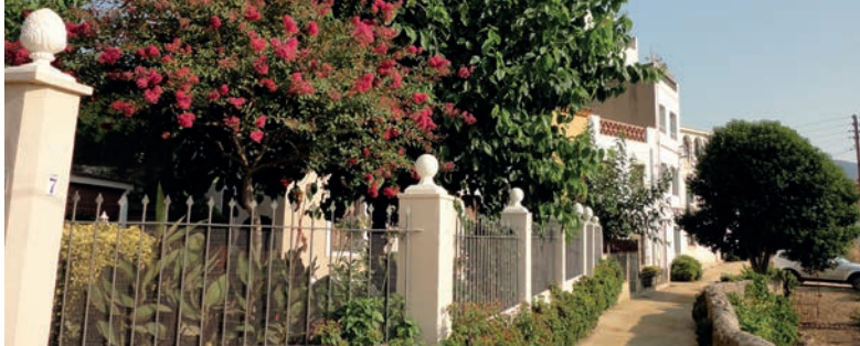
Ruta Domènec Perramon: Can Barbeta