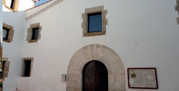
Ruta Domènec Perramon: Can Borrell

Divendres 25 d'octubre, a les 7 de la tarda