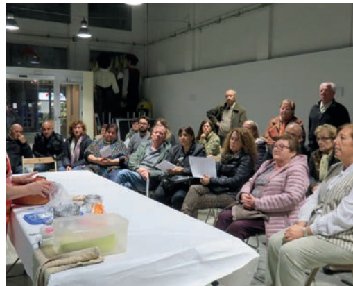
Jornades pràctiques d'elaboració de "relleno"

Tiquets a la venda a les consergeries dels dos pavellons poliesportius i a l'OAV de l'Ajuntament