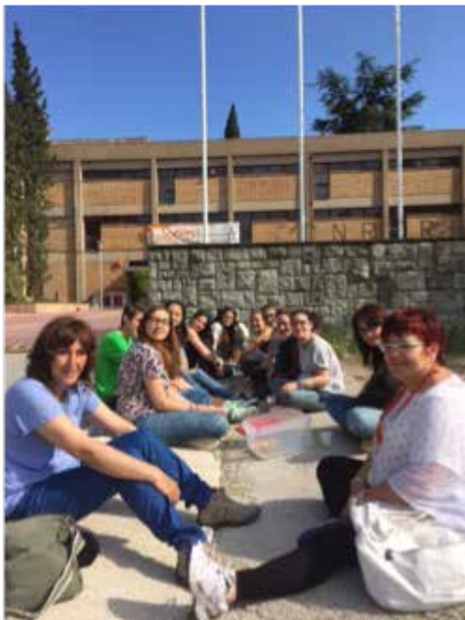
Equip de Mediació 2015-2016.

El programa de Convivència i Mediació es va començar a implementar a en el curs 2014-2015, arrel de la voluntat d'incorporar noves línies de resolució de conflictes i de millora de la convivència a l'Institut Domènec Perramon .