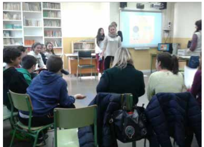
Formació pràctica en Mediació.