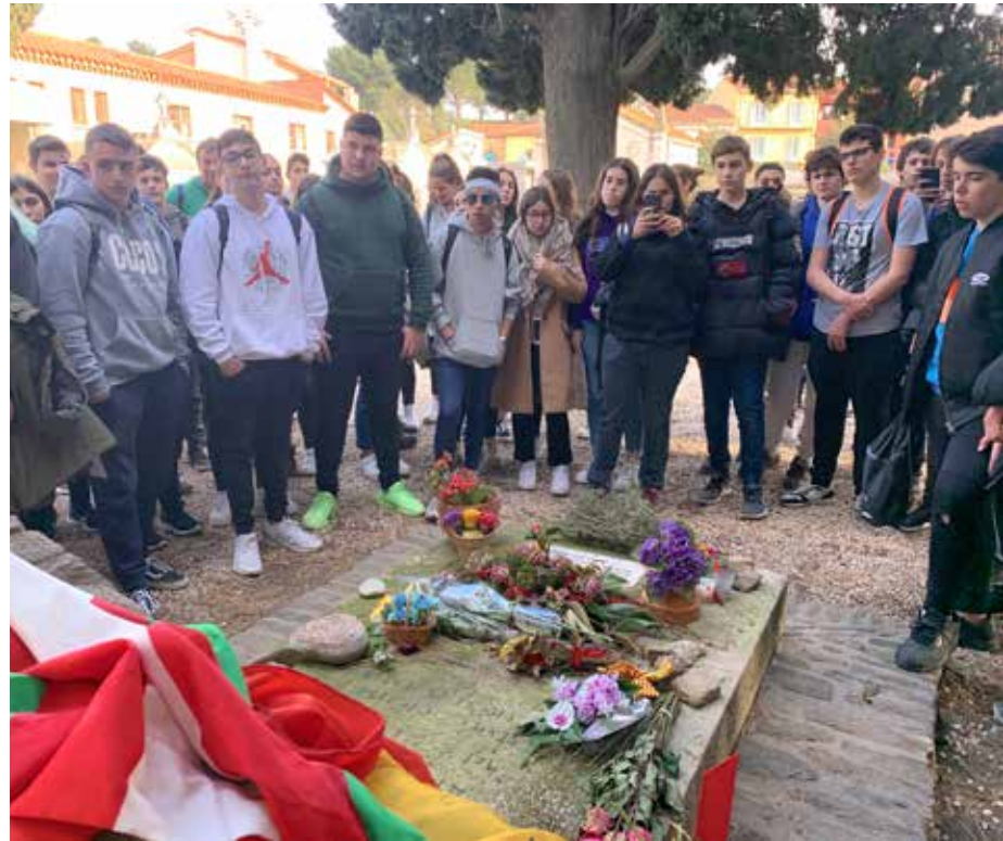
Sortida a la Maternitat d'Elna i Cotlliure, visita a la tomba d'Antonio Machado