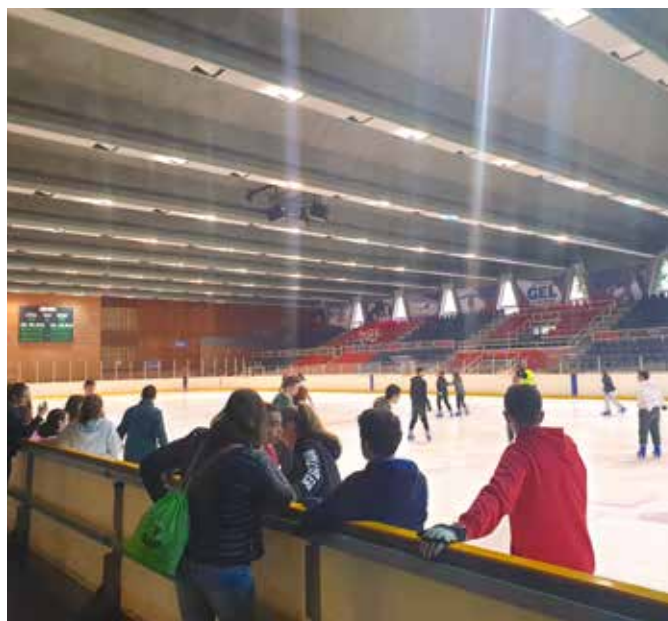
Premi del Pla Lector, patinatge sobre gel al Palau Blaugrana