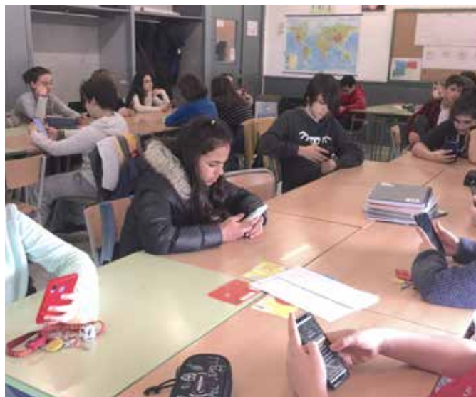
Pla Lector, lectura en anglès del "Live Books"

Com hem comentat, al Perramon pensem que tan importants són els aprenentatges humanístics com els científicotecnològics, ja que ambdós són essencials per desenvolupar-se satisfactòriament en el segle XXI. Al centre hem apostat per tots ells i sempre que hem pogut els hem integrat, per exemple, en el projecte Rock'in o en el Pla Lector. Per al curs vinent començarem el treball amb ordinadors i dispositius digitals a l'aula . Durant el curs acabarem de concretar-ne els detalls, però algunes matèries ja han començat a treballar enguany amb plataformes digitals, per exemple ciències experimentals, que entren la plataforma Science Bits.