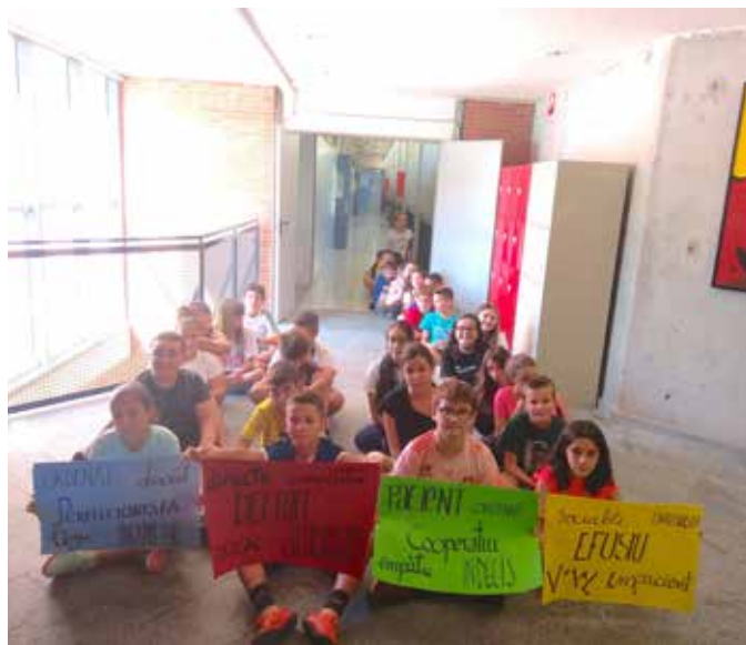
Activitat d'Educació Emocional i matemàtiques

La convivència i el benestar de l'alumnat es gestiona a través de la mediació i del Projecte Emocional. Aquest darrer s'ha consolidat com un dels puntals del centre; ha arrelat a 1r i 2n d'ESO i enguany s'ha ampliat a 3r i 4t d'ESO. L'educació emocional es treballa amb activitats molt diverses des de les diferents matèries (educació física, matemàtiques, llengua, i cultura i valors) i des de les matèries optatives d'educació física.