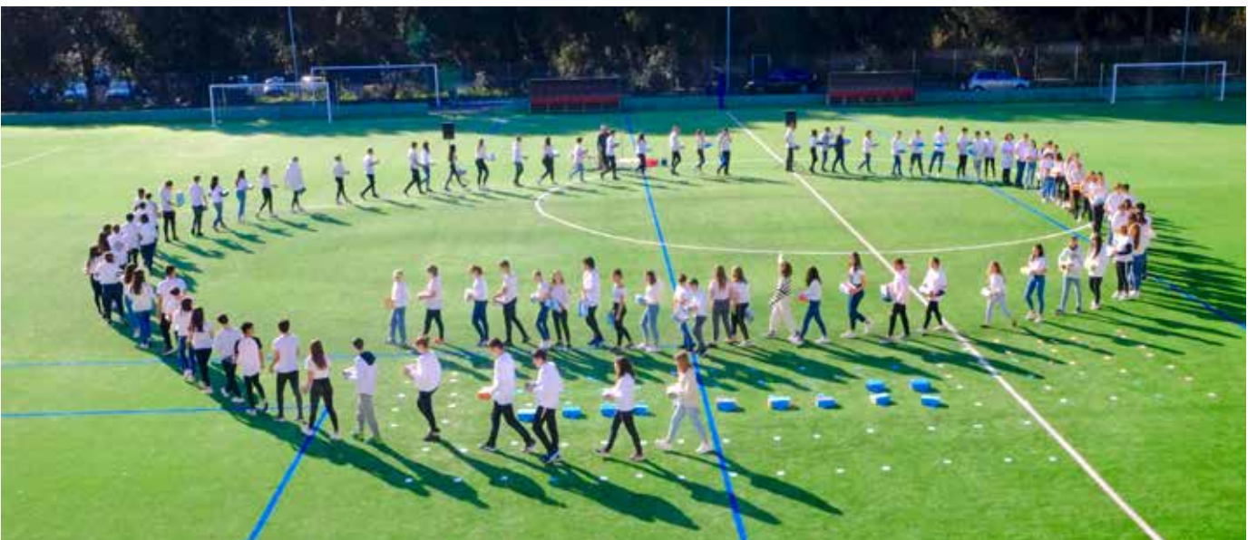
Commemoració de la taula periòdica