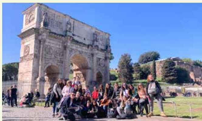
Viatge de final d'estudis 2n Batxillerat a Roma (curs 18-19)

L'AMPA ens representa a tots i volem que tothom se senti lliure d'expressar les seves opinions; per això, us animem a fer-nos arribar els vostres dubtes i les vostres inquietuds com a pares, i si disposeu de temps per participar en alguna de les activitats que preparem, sereu molt benvinguts.