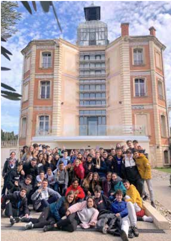
Sortida a la Maternitat d'Elna i Cotlliure, visita a la Maternitat