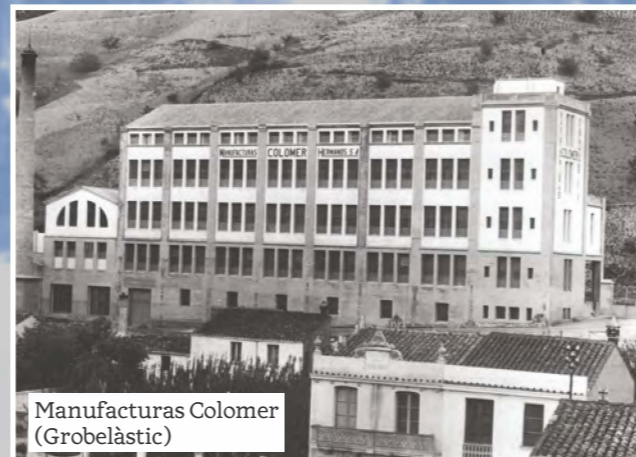
Manufacturas Colomer (Grobelàstic)