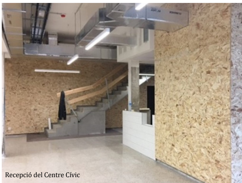
Recepció del Centre Cívic

S'ha respectat el paviment de terratzo original, mentre que per a la zona del bar s'ha optat per un paviment continu de color marró. L'estructura, paviments i sostres és l'únic que s'ha mantingut de l'edifici originari. En general s'ha optat per materials sobris, resistents i de fàcil manteniment.