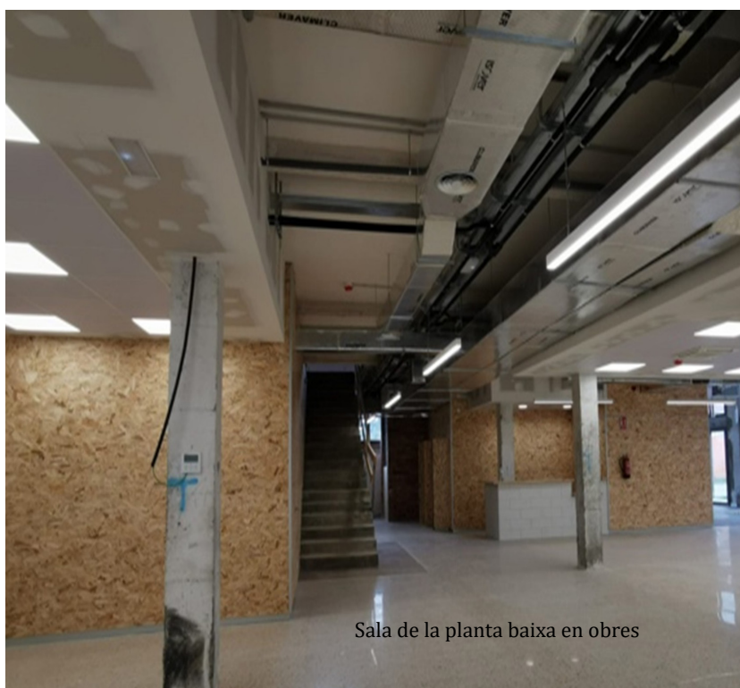
Sala de la planta baixa en obres