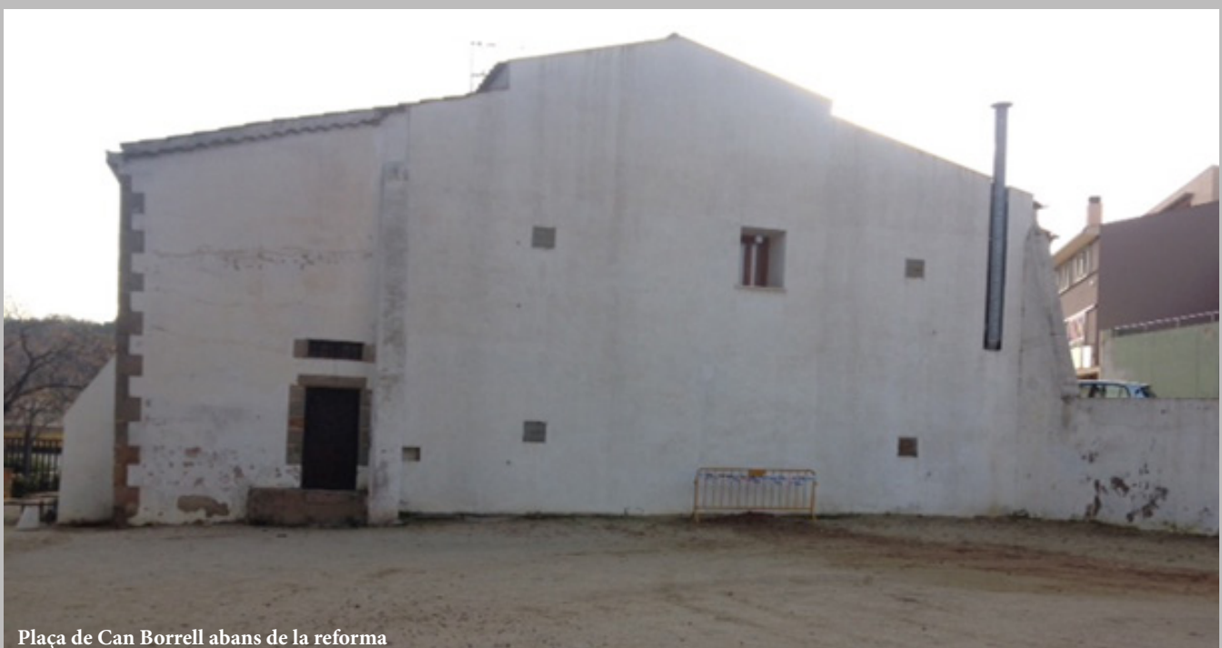
Plaça de Can Borrell abans de la reforma

El cost per a la realització d'aquesta obra ha estat de 58.870 euros.