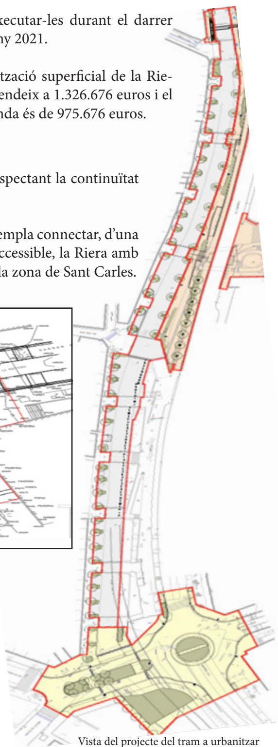
Vista del projecte del tram a urbanitzar

de 20.000 vehicles, un volum de trànsit molt elevat i que en hores punta arriba a col·lapsar la sortida i l'entrada d'Arenys de Munt. La rotonda també facilitarà les maniobres dels vehicles pesants i de gran tonatge que accedeixen o surten del polígon industrial.