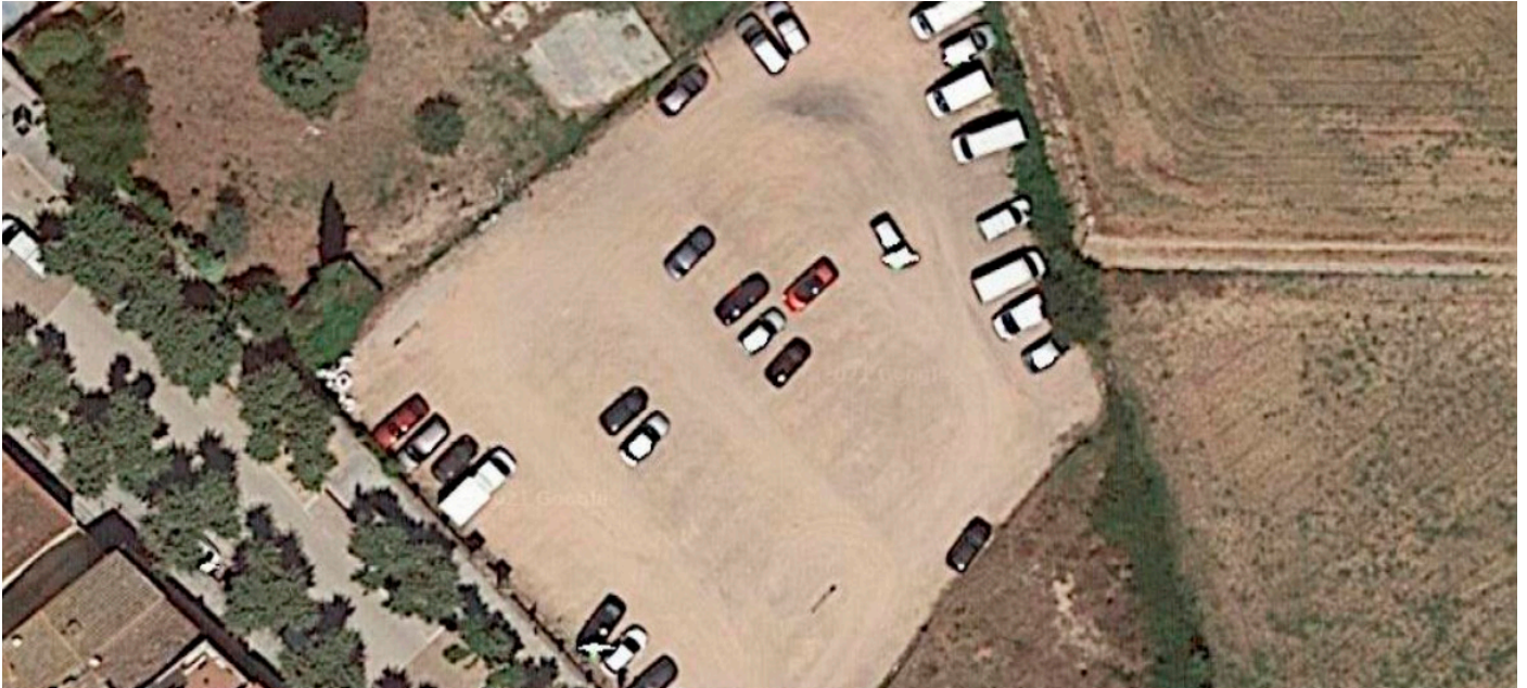
Ubicació de la futura residència municipal als terrenys de Can Globus / Ca l'Espàrrec

La redacció del projecte executiu, que es licitarà aquest any, finalitzarà el 2022 i es preveu iniciar la primera fase de les obres l'any 2023.