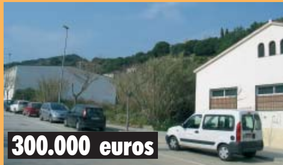
Reurbanització carrer de les Flors