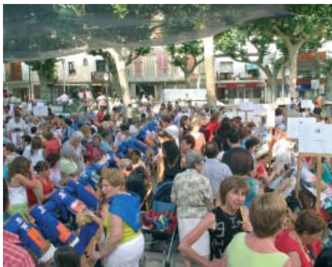
El patrimoni local és clau per intensificar el «turisme de proximitat»

vam començar a treballar en el Pla de Desenvolupament Turístic. Les preguntes fonamentals sobre les