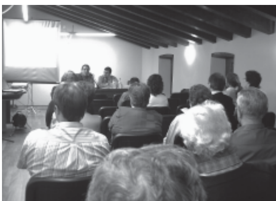
El Reglament és fruit del Pla Director de Participació Ciutadana

En el ple del 3 de març d'aquest any, l'Ajuntament d'Arenys de Munt va aprovar el Reglament de Participació Ciutadana, un document que emana del Pla director de Participació i pretén regular algunes de les accions proposades i també tot d'elements per facilitar i ordenar la participació ciutadana. El Reglament