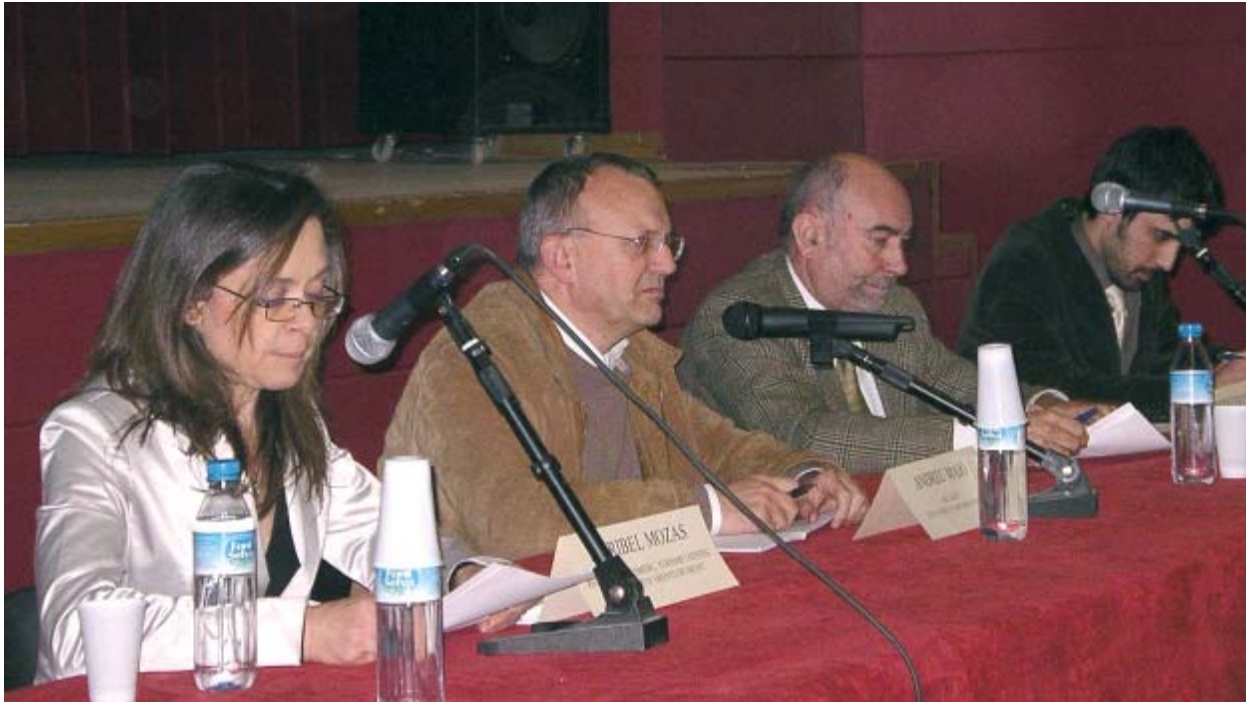
El Pla de Desenvolupament Turístic d'Arenys de Munt es va presentar a principi de març a la Sala Municipal

La cultura és un element fonamental en tota proposta turística. El turista de cultura és una persona formada i respectuosa amb l'entorn. El Pla es centra bàsicament, si més no en una primera fase, a captar o a incrementar l'anomenat «Turisme de proximitat», és a dir aquelles persones que passen mig dia o un dia fora de la seva llar o hotel, on gaudeixen d'uns dies de descans i oci, i volen visitar llocs d'interès, bé sigui pel seu patrimoni arquitectònic, bé per les seves activitats culturals i