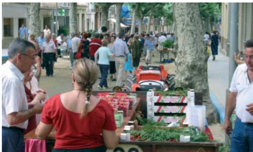
La Cirera d'en Roca té un paper destacat en el Pla de Desenvolupament Turístic

Haurem de ser realistes i objectius en la creació de productes turístics. S'han de tenir punts de vista sincers i valents, prediccions i reflexions serioses a la hora de prioritzar ofertes i crear nous pols d'interès, que siguin coherents amb el nostre territori i el nostre municipi.