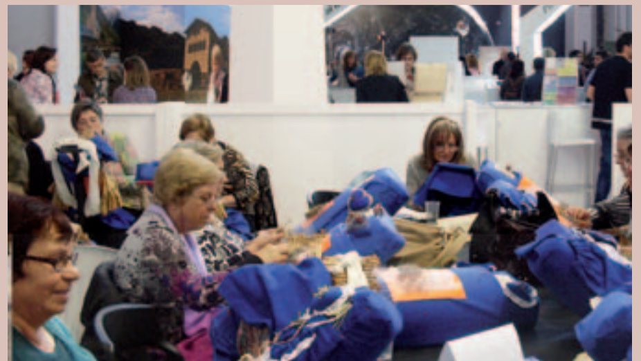
Les Puntaires Verge del Remei al Saló Internacional de turisme de Barcelona

El poble d'Arenys de Munt va estar representat per les Puntaires Verge del Remei en la inauguració del Saló Internacional de Turisme de Catalunya (SITC), celebrat a Barcelona.