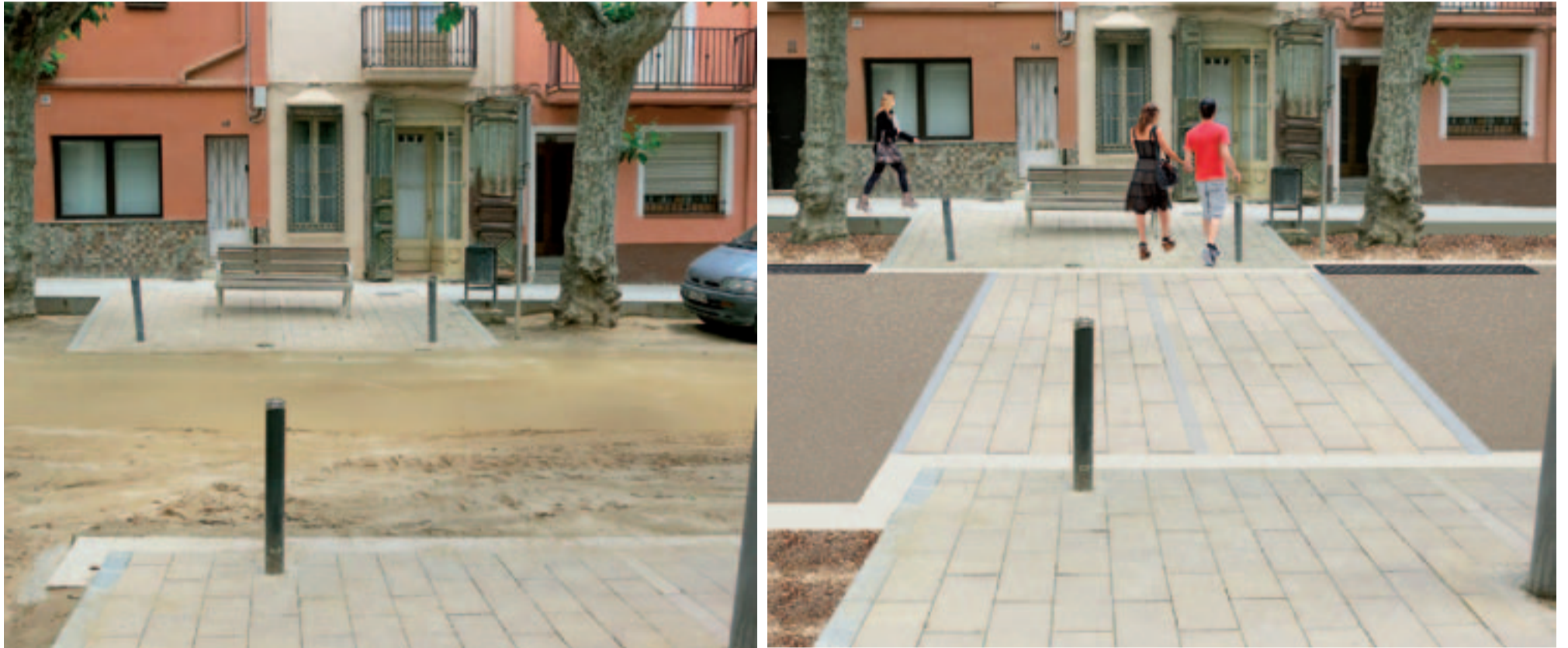
Imatges de com quedaria un tram de Riera amb l'asfaltat final i les llambordes. A l'esquerra foto actual, a la dreta projecció virtual dels acabats

Aprovat l'expedient de contribucions especials, a partir del dilluns 2 de juny, el tècnic informador de les obres de la Riera atindrà personalment a l'ajuntament a tots els veïns/es que vulguin consultar qualsevol qüestió relacionada amb el projecte o els imports de les contribucions especials