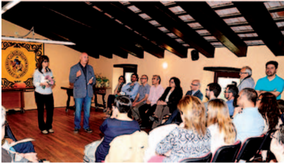
Moments de la presentació de la segona edició del premi Brenda Hudson Perramon, Masia Can Borrell

Diumenge 18 de maig, a la Masia de Can Borrell, es va celebrar l'acte de Lliurament de premis de la XXVI Mostra Literària 2014 d'Arenys de Munt i de la convocatòria del premi Brenda Hudson Perramon.