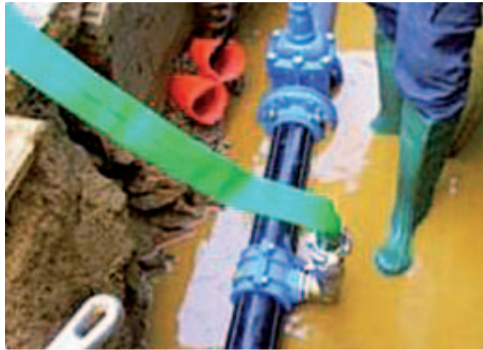
Les activitats que ha anat assumint GUSAM SA s'han consolidat l'any 2013, el primer exercici complert d'Aigües d'Arenys, deixalleria, escola bressol i neteja d'edificis

El resultat de l'exercici ha estat positiu, amb un superàvit de 89.843,74 euros que es distribuirà a reserves de la societat.