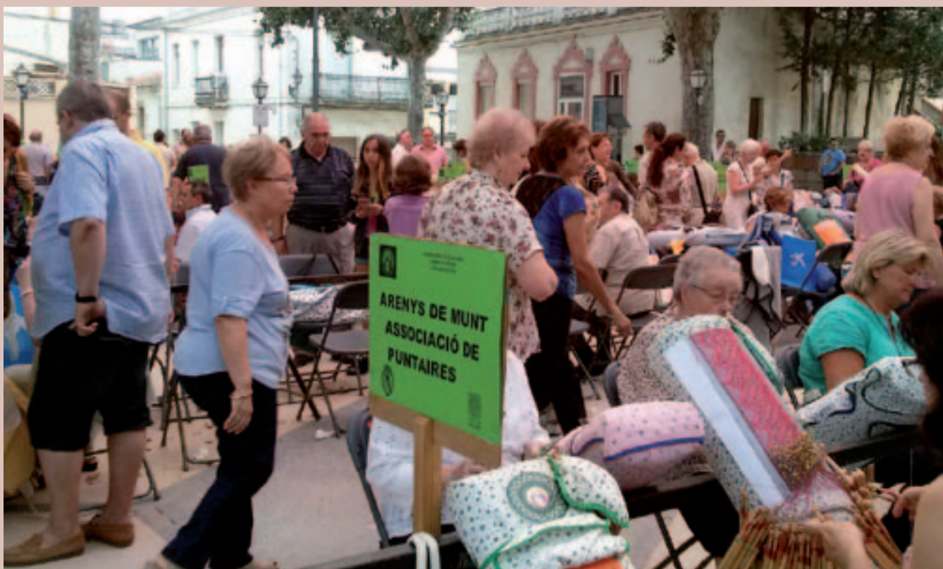
XXI trobada de puntaires a la Plaça de l'Església