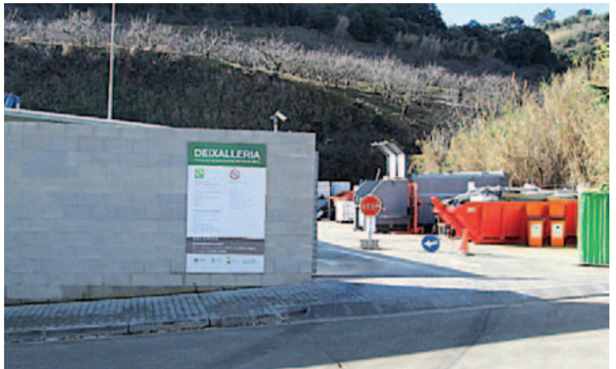
Entrada de la Deixalleria mancomunada entre els tres municipis d'Arenys de Munt, Arenys de Mar i Sant Iscle de Vallalta

La introducció de la nova tarifa reduïda d'escombraries equivalent en un descompte del 10% sobre el rebut de la brossa, ha repercutit favorablement en l'augment en el nombre d'usuaris de la Deixalleria