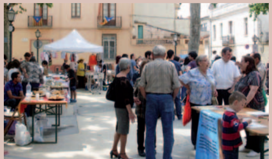
La Plaça de l'Església es va omplir de gent i molta activitat amb la Festa del Comerç Just

Diumenge 11 de maig es va celebrar la Fira de la Maduixa que va comptar amb una considerable afluència de públic. Els productors van fer una bona venda i van promocionar la Maduixa del Maresme. Conjuntament amb la fira, com ja és costum, es va celebrar la Festa del Comerç Just i la Banca Ètica.