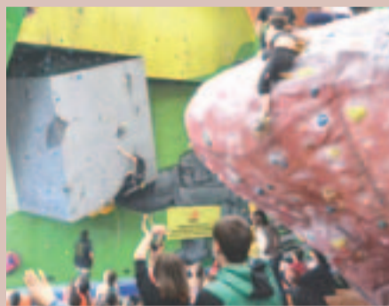
Sala Golem plena de públic

El passat 29 de març es va celebrar a la Sala Golem Escalada & Fitness, la primera prova de la Copa Catalana de Dificultat, organitzada per la FEEC.