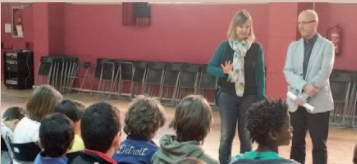
Els nens i nenes de tercer de primària de l'Escola Sant Martí en el moment de començar la sessió preguntes a l'alcalde

Els nens i nenes de tercer de primària de l'Escola Sant Martí van visitar l'ajuntament d'Arenys de Munt el passat 18 de març, per conèixer les instal·lacions municipals i fer preguntes a l'alcalde. Aquesta activitat forma part del projecte educatiu i es duu a terme anualment.