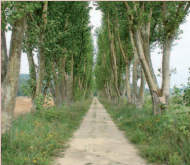
Parc municipal Can Jalpí

L'ajuntament d'Arenys de Munt participa en el projecte Viles Florides, que distingeix aquelles iniciatives on la flor i la planta ornamental són protagonistes, presentant al concurs els espais verds, els parcs i jardins que configuren i perfilen el municipi amb zones singulars com el Parc de Can Jalpí o els plàtans de la riera, i les iniciatives de repoblació de l'alog, l'espècie autòctona del Maresme en situació de retrocés.