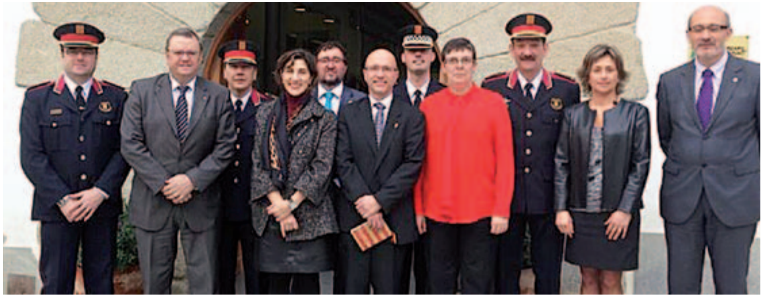
La Junta de Seguretat davant l'entrada de l'Ajuntament d'Arenys de Munt

Al llarg de la reunió també es va parlar de la coordinació entre els cosos de Mossos d'Esquadra i la Policia Local així com d'altres temes d'interès per al municipi d'Arenys de Munt.