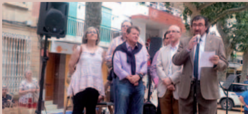
Inauguració de la XV Fira de la Cirera amb els alcaldes de pobles veïns

Com ja és costum es va fer el concurs d'escupir pinyols amb molta participació de públic. La XXI trobada de puntaires va acabar d'arrodonir l'èxit de la fira que un any més va comptar amb molta afluència de gent.