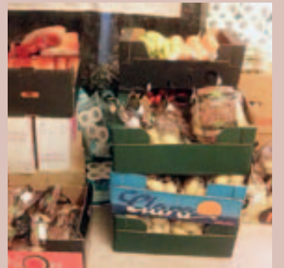
El magatzem d'aliments requereix unes noves instal·lacions

L'espai i l'activitat que s'hi desenvoluparà està recollit en el projecte presentat a La Caixa que va ser elaborat com a primer objectiu de la regidoria. El nou Magatzem s'anomenarà "D.I.S.A.M." Distribució Solidària d'Aliments d'Arenys de Munt.