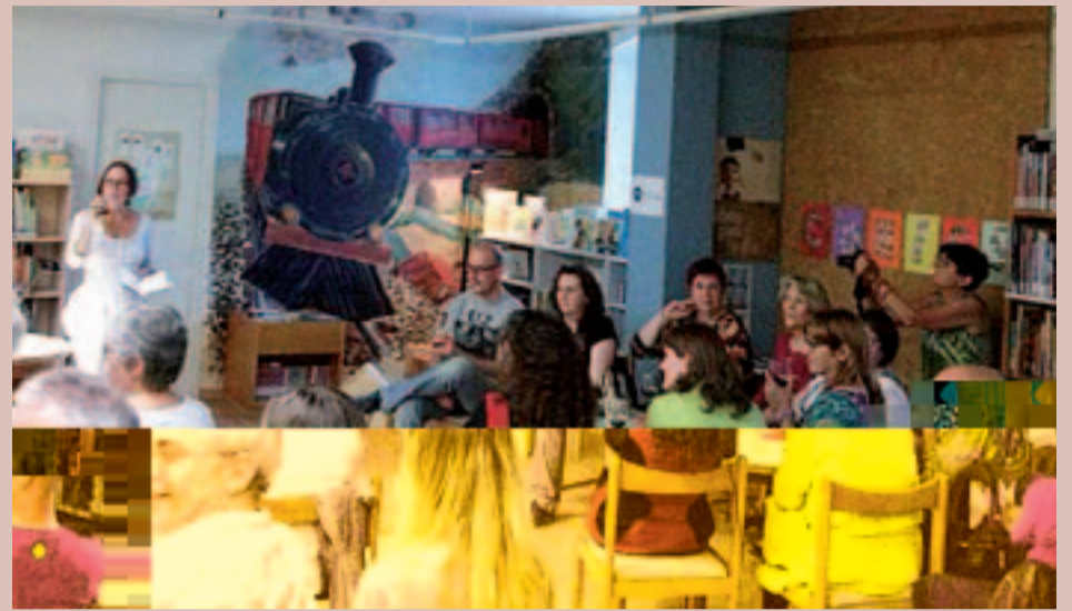
El públic assistent va poder gaudir d'un maridatge literari a la Biblioteca Municipal d'Arenys de Munt

Divendres 6 de juny va tenir lloc, a la biblioteca Antònia Torrent i Martori, el I Maridatge literari en el que es va poder gaudir tant del vi com de les lectures preparades.