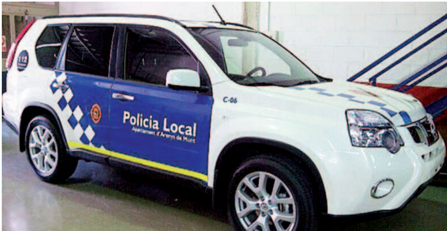
Disposar d'un vehicle per a la Policia Local és una demanda llargament esperada per la Regidoria de Governació

Després de mesos d'espera, el nou cotxe de policia està a punt d'arribar. La renovació del cotxe de la policia ha estat una necessitat atès els elevats costos de manteniment i reparació del Nissan Terrano II i el Nissan X-Trail.