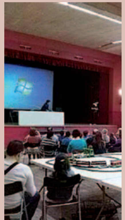
Inici de les activitats a la Sala Municipal