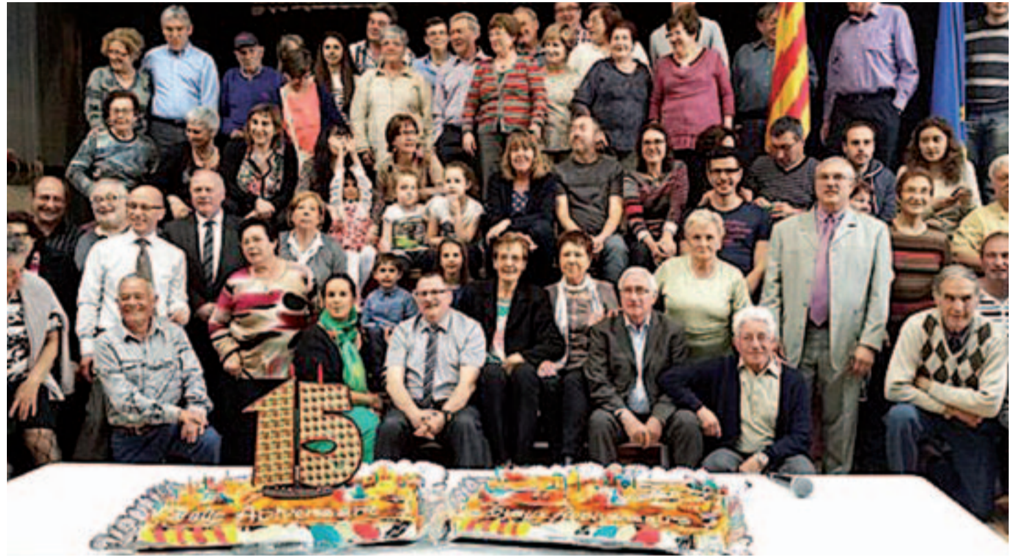
Foto de família. Membres de les Comissions d'Agermanament amb Feytiat amb el pastís commemoratiu del 15è aniversari a la Sala Municipal

El cap de setmana del 25 al 27 d'abril es van celebrar a Arenys de Munt els actes de commemoració del 15è aniversari de l'Agermanament entre Arenys de Munt i Feytiat, amb tot un seguit d'actes que es van celebrar al llarg dels tres dies.