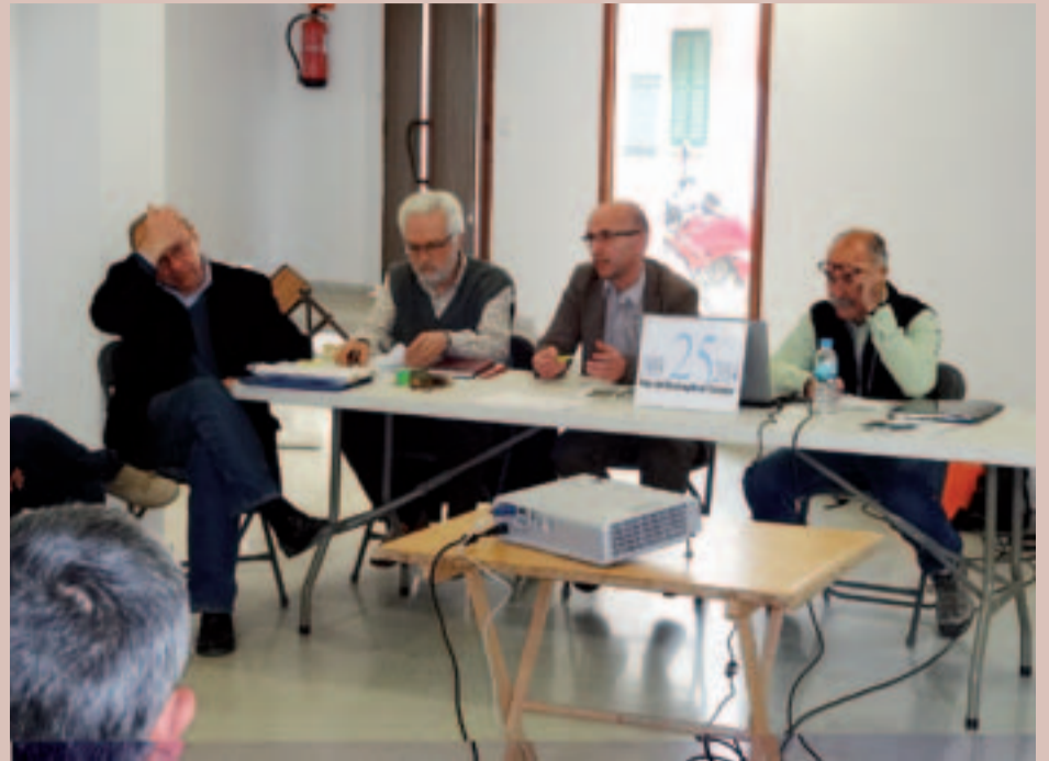
Reunió de la Comissió Consultiva del Parc a la Sala d'exposicions d'Arenys de Munt

Aquest 2014 es commemorarà el 25è aniversari del Parc del Montnegre i el Corredor. Aquesta qüestió va ser un dels temes tractats a la reunió de la Comissió Consultiva del Parc, celebrada a la Sala d'Exposicions d'Arenys de Munt el passat 24 de març.