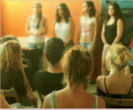
Els joves participants van cantar tres temes davant familiars i amics/es-

Dimarts 10 de juny va tenir lloc al Casal de Joves l'Escorxador l'acte de tancament del Taller de Cant per a joves, promogut per la regidoria de Joventut.