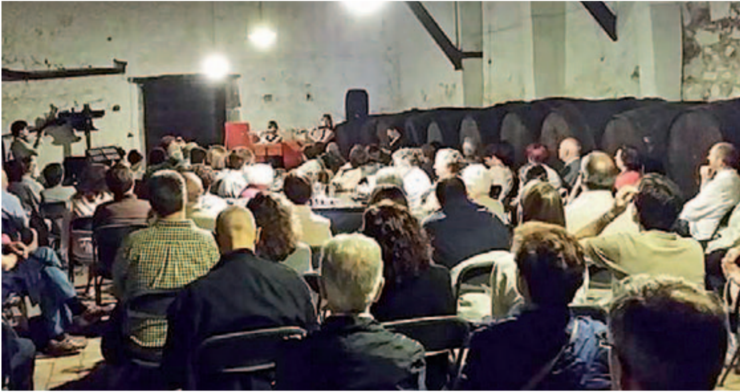
Moment de l'actuació del grup de música barroca Càssia a Can Sala de Dalt