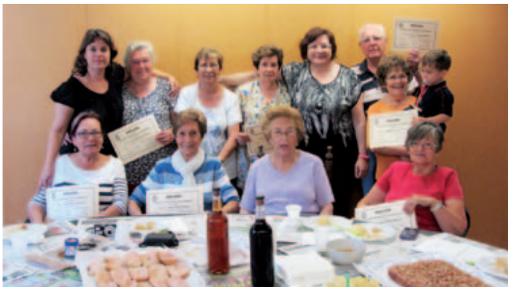
Moment de la celebració de la cloenda del Taller de la Memòria després de l'entrega dels diplomes

El segon nivell del Taller de la Memòria, que va començar el 16 d'abril, ha finalitzat dijous 19 de juny. Fins ara s'havien celebrat diferents sessions del primer nivell i aquesta és la primera experiència amb un nivell més elevat.