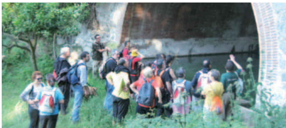
A les passejades han participat més d'una setantena de persones

Els diumenges 18 de maig, 1 i 8 de juny, com cada primavera, van tenir lloc les passejades a peu guiades per Arenys de Munt, per conèixer l'entorn de la vila i el seu patrimoni natural i històric. Les caminades es van fer a la font de l'Aulet, la font de l'Aigua Roja i la font d'en Trici. Enguany les sortides han estat relacionades amb les fonts i els safareigs.