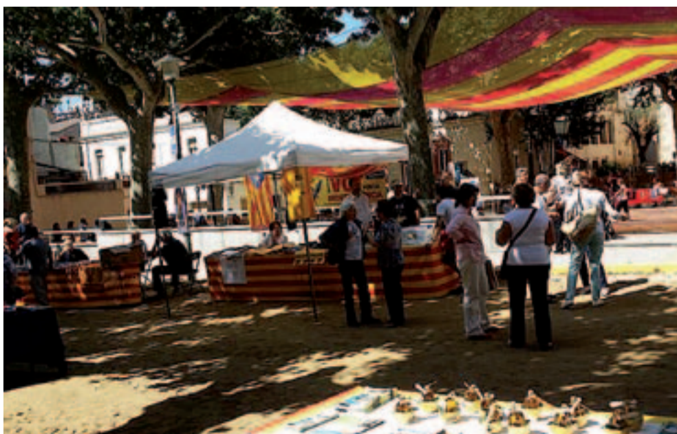
A la Mostra d'entitats es van aplegar a l'entorn de la plaça de l'església i a un tram de la Riera, divuit entitats de diferents àmbits -cultural, esportiu i social- d'Arenys de Munt

Per a suggeriments de millora en l'enllumenat d'Arenys de Munt pot utilitzar l'aplicació Reparaciutat, o adreçar-se a l'Oficina d'Atenció de la Vila.