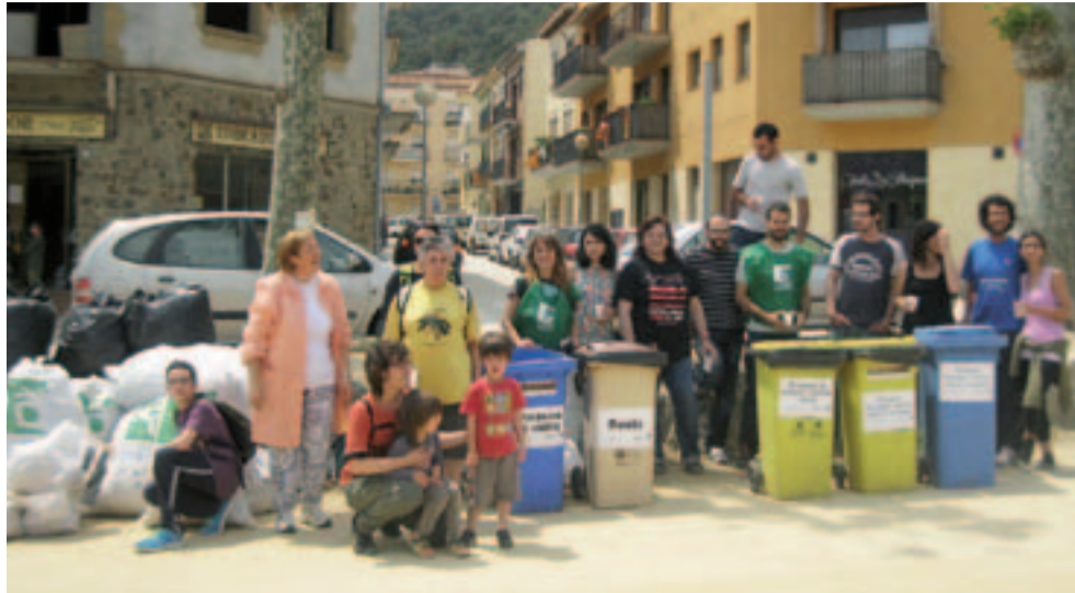
El grup de veïnes i veïns voluntaris després de Fem Dissabte a la Riera Sobirans

El passat dissabte 10 de maig es va celebrar a Arenys de Munt la jornada de neteja de les rieres i espais fluvials de Catalunya, el Fem Dissabte!. Es tracta d'una iniciativa organitzada per l'Agència de Residus de Catalunya, en col·laboració amb l'Associació Hàbitats, i que compta amb la participació anual d'un miler de voluntaris i voluntàries a tot Catalunya. L'activitat es va sumar a la campanya Let's Clean Up Europe!