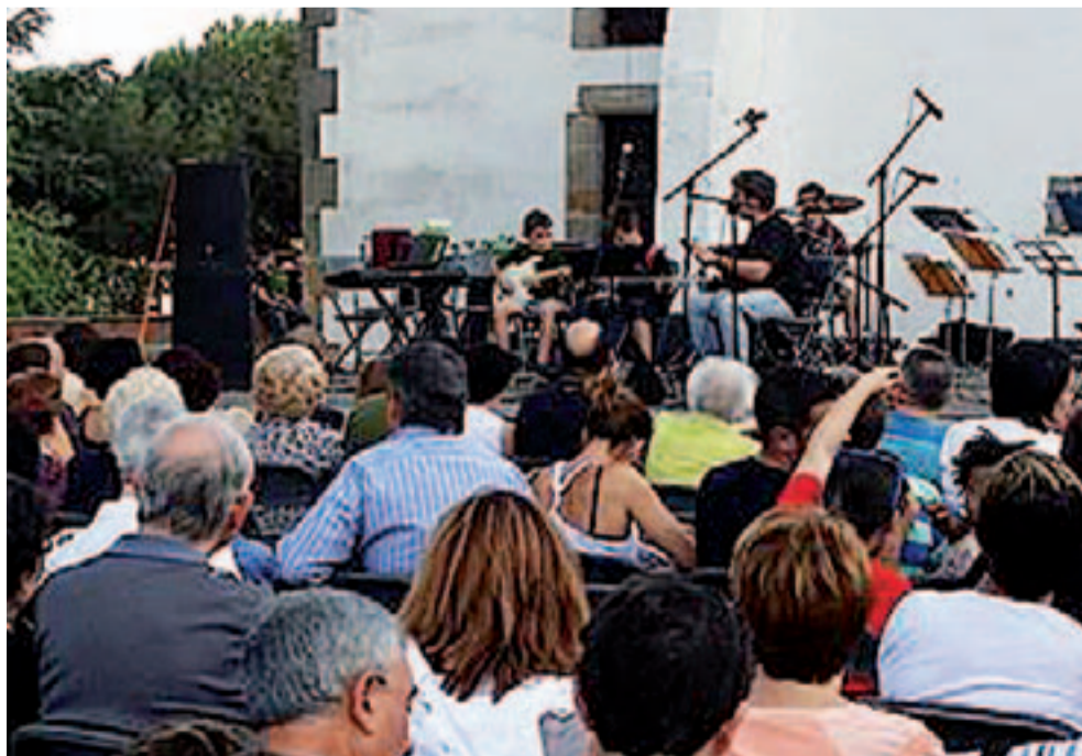
L'acte de la tarda amb nens i joves estudiants de música va estar molt concorregut

Davant la bona acollida que va tenir aquesta versió nocturna, l'any vinent es potenciarà amb la incorporació de més grups.