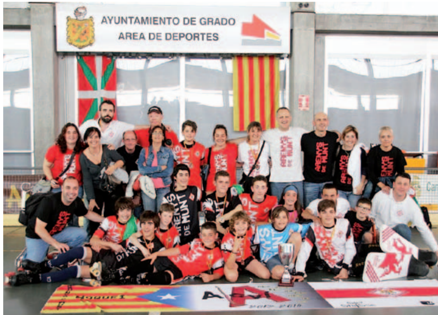
Foto de grup. Els membres de l'equip Aleví A d'Arenys de Munt, campions d'Espanya i subcampions de Catalunya, acabada la competició estatal a Grado