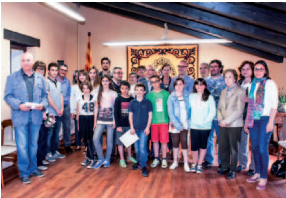
Premiats, membres del jurat amb l'alcalde i regidores/es de l'ajuntament d'Arenys de Munt

A la plaça de l'Església, durant tot el matí de diumenge, es va poder participar en l'activitat per elaborar el Setè Llibre Gros d'Arenys de Munt, on petits i grans van compondre textos que després van ser il·lustrats per voluntaris.