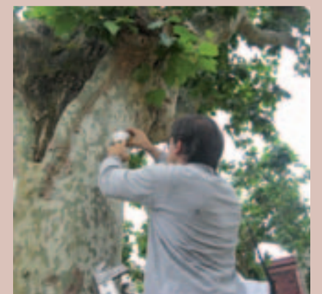
El nou tractament de l'arbrat és natural i suposa una agressió al medi ambient

Ja hi ha experiències des de fa uns quants anys en el tractament biològic del tigre dels plàtans en ciutats com Girona, Lleida i Martoró, i que tenen bons resultats.