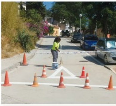
Brigada Jove 2016

Nº 52 - AGOST 2016 - Publicació trimestral