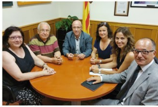
Donació de La Caixa de 15.000 €