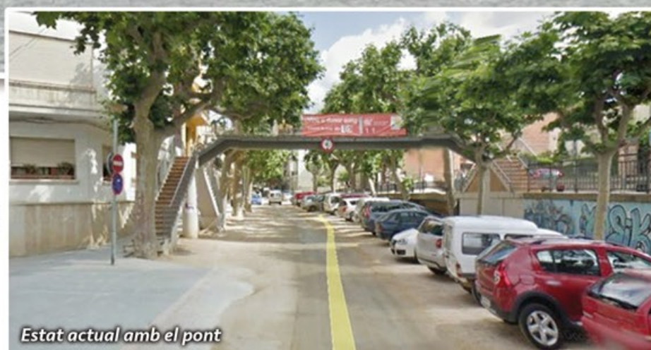
Estat actual amb el pont