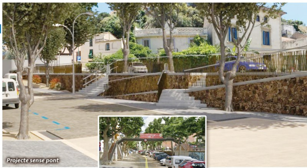
Projecte sense pont