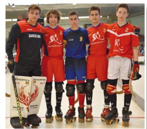
Jugadors del Centre d'Esports d'Arenys de Munt, campions de Catalunya