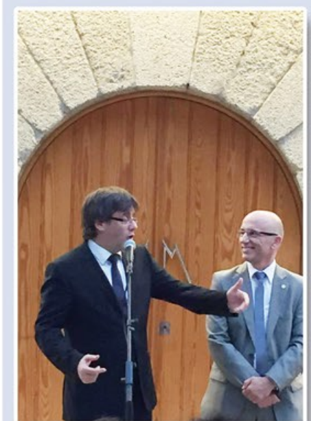
Visita del President de la Generalitat a Arenys de Munt