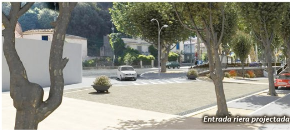
Entrada riera projectada

El projecte d'urbanització superficial de la riera entre el rial Bellolell i el carrer de la Rasa s'ha presentat i debatut en els Consells d'Urbanisme del 09/12/2015 i del 31/03/2016.