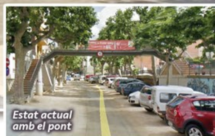
Estat actual amb el pont

En el consell del 07/06/2016 es va explicar el projecte aprovat definitivament i s'explicà el compromís del Ple sobre el multireferèndum que es durà a terme abans no finalitzi el 2016, en el que també es preguntarà sobre si la riera ha de ser per a vianants i sobre el pont.