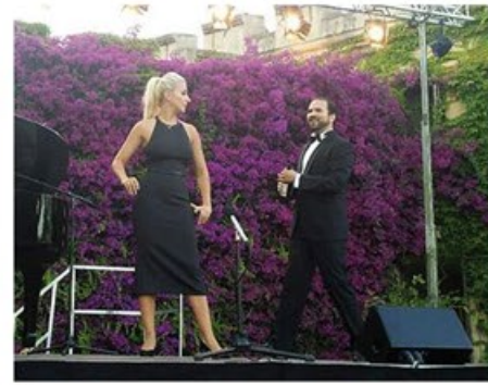
18è Festival de Santa Florentina