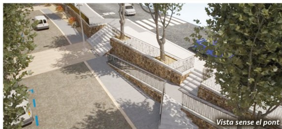
Vista sense el pont