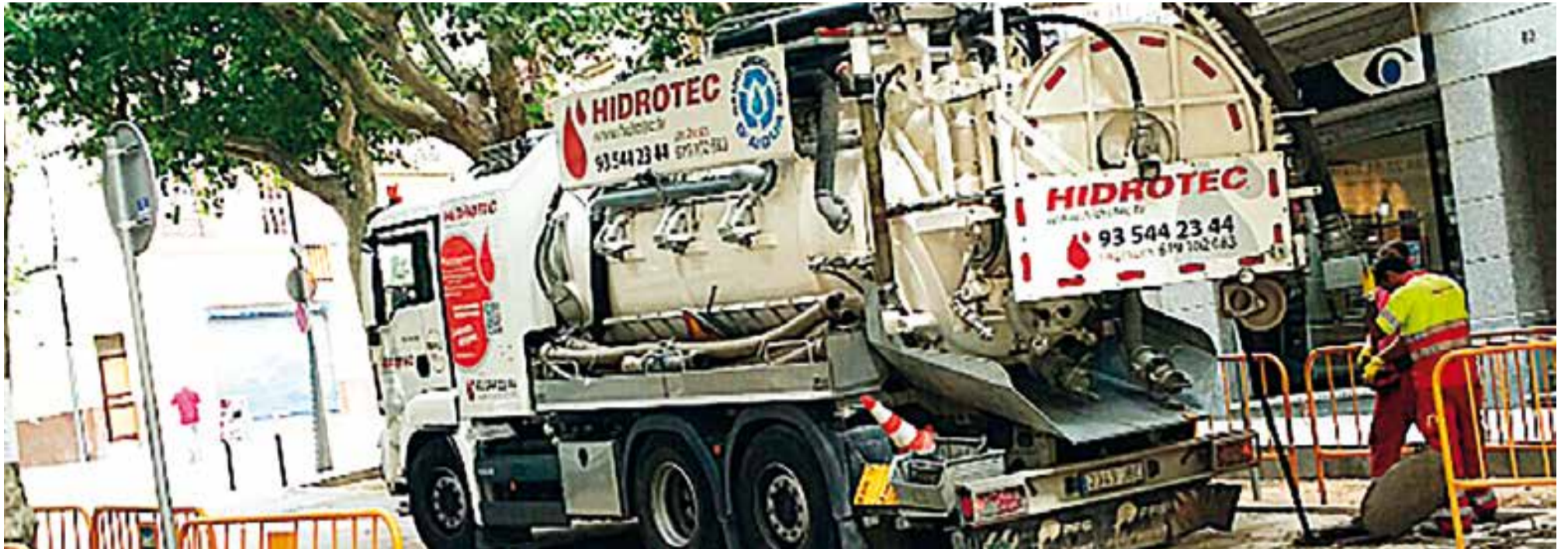
Actuacions preventives de neteja del clavegueram acabada l'obra d'urbanització superficial

Dijous 24 de setembre, a la tarda, la mobilitat a la part alta de la riera i a l'Eixample va recuperar la seva normalitat, un cop finalitzades les obres d'urbanització superficial i corregits els defectes del paviment que es van posar de manifest just abans d'acabar l'obra. Inicialment estava previst obrir al trànsit aquest tram de la riera el passat dia 14 de setembre, però no va ser així a causa de les taques en el paviment, que l'empresa constructora ha hagut d'eliminar havent de retirar l'asfalt i tornant-lo a posar. L'obra d'urbanització superficial de la riera es repeteix per part de l'ajuntament amb una llista de petits acabats pendents d'enllestir o de comprovar el seu comportament en les properes setmanes.