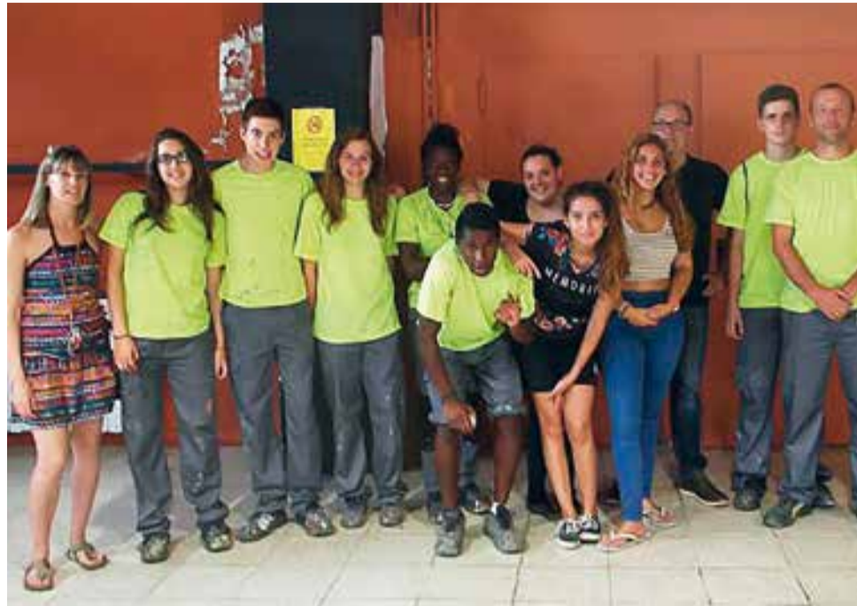
La Brigada Jove ha realitzat tasques de pintura i manteniment dels espais públics

El 31 d'agost es va celebrar la cloenda del segon torn de la Brigada Jove. Aquest mes d'agost els participants han estat fent treballs centrats en pintar, netejar i escatar herbes dels espais i equipaments municipals.