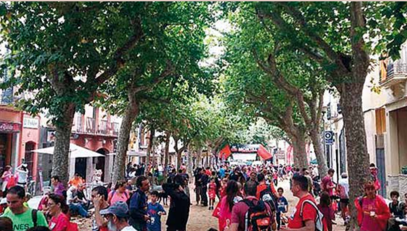
La Riera es va omplir dels participants de la 27a edició de la Marxa