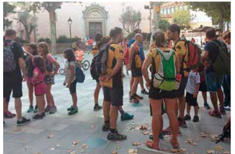
Pimera sortida nocturna a la piscina municipal

El divendres 28 d'agost, més de cent persones van participar a la I Sortida Nocturna a la piscina municipal. A 2/4 de 8 del vespre, des de la plaça de l'Església, va donar inici la passejada camí del cementiri i, després de travessar la carretera, per l'antic Camí del Corral, es va anar a buscar el camí amagat que arriba fins a Lourdes. A les 9 del vespre es va arribar a la piscina on tots els participants van sopar i es van banyar fins a les 11 de la nit.