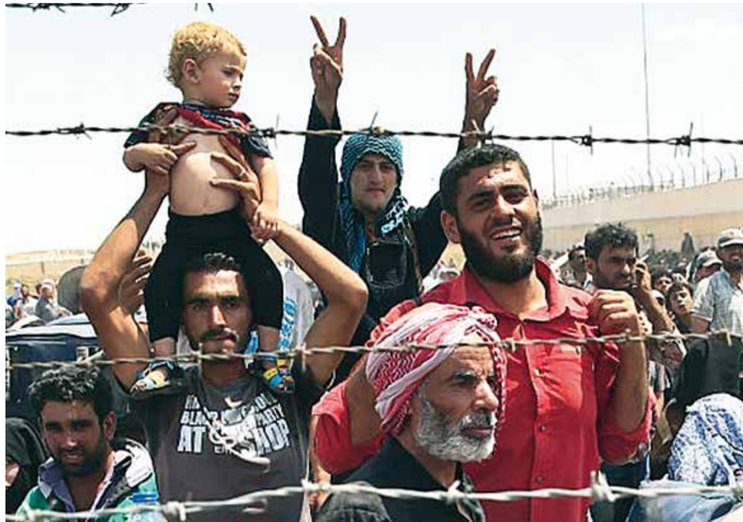
Milers de famílies sirianes fugen del conflicte bèl·lic del seu país

El consistori municipal, en el ple del dia 10 de setembre, va fer una Declaració Institucional on expressa el seu suport a la població afectada pel conflicte de Síria, i es compromet a participar activament en les iniciatives que sorgeixin de la societat civil i de les diverses institucions, per tal de minimitzar l'impacte d'aquesta tragèdia humanitària.