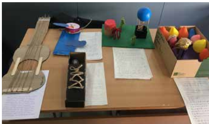
Contes i creacions artístiques del concurs "Contes a l'Esprint"

Microrelats Donaviva, concursos de Booktrailers, The Fonix, Certamen de lectura en veu alta, Contes a l'esprint, Problemes a l'esprint, First Lego League, Fem Mates, Anem a per + mates, Copa Cangur, Proves Cangur i Olimpíada Matemàtica telemàtica.