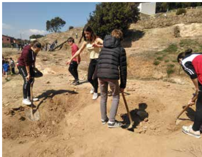
Visita i tallers al poblat ibèric de Ca n'Oliver de Cerdanyola

És en aquest marc de coneixement i sensibilització (que abraça el coneixement des de l'àmbit local del propi municipi fins a la realitat europea i mundial) en què s'inscriuen moltes de les activitats i sortides del centre: estada lingüística a Harrogate (amb alumnes de 1r d'ESO fins a 4t d'ESO), viatge a Roma (amb l'alumnat de batxillerat), a Múnic i a la maternitat d'Elna (amb els de 4t d'ESO), a un poblat ibèric (amb els alumnes de 1r d'ESO) o a un castell gòtic (amb els de 2n d'ESO), caminades per Arenys de Munt per a la recollida de brossa, treball i visita de l'exposició "Escoles d'altres mons" i participació a l'activitat "La Città Infinita", ambdues amb la col·laboració de la Diputació i l'Ajuntament, el Servei Comunitari (en què els alumnes, entre 3r i 4t d'ESO, coneixeran entitats del poble que treballen per a la millora social i hi prestaran serveis) o xerrades amb escriptors, entre d'altres.