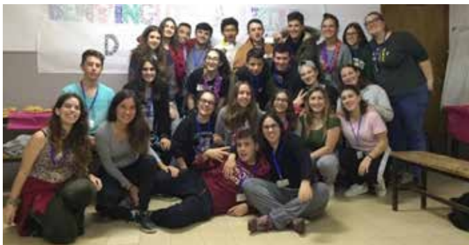
Estada de mediació dels nous mediadors

El passat mes de novembre del 2018, un grup de vint-i-dos alumnes va acabar la formació de 40 hores que són necessàries per poder ser mediadors escolars. Aquesta formació es va finalitzar amb una estada de mediació de dos dies a la casa de colònies de Can Bosch, a Sant Iscle de Vallalta, on els mediadors nous van acabar-se de formar i els vells van donar-los la benvinguda a l'Equip de Mediació.