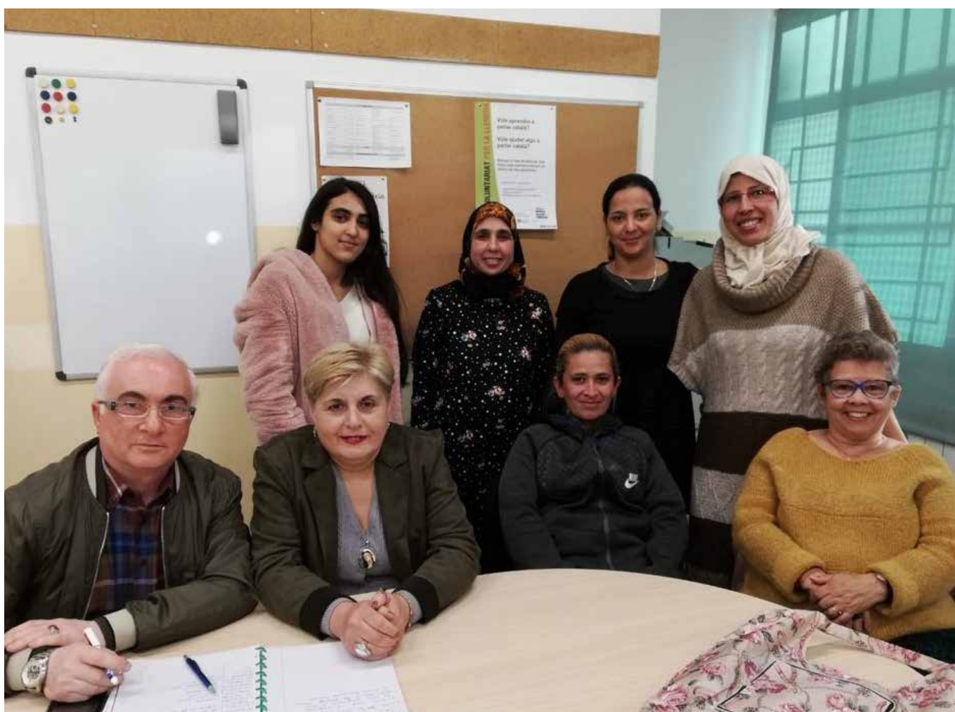
Satisfets amb la feina feta després de l'entrevista.