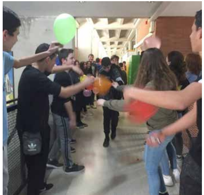
Gravació del lipdub

Per a aquesta actuació, en què va participar tot el centre, es va realitzar un treball previ dins les tutories en relació amb la reflexió i desenvolupament dels conceptes convivència i pau a través de la cançó escollida per al lipdub , Hijos de la Tierra de Nil Moliner. Posteriorment se'n va fer la gravació i la producció, tot plegat fet per alumnes mediadors.