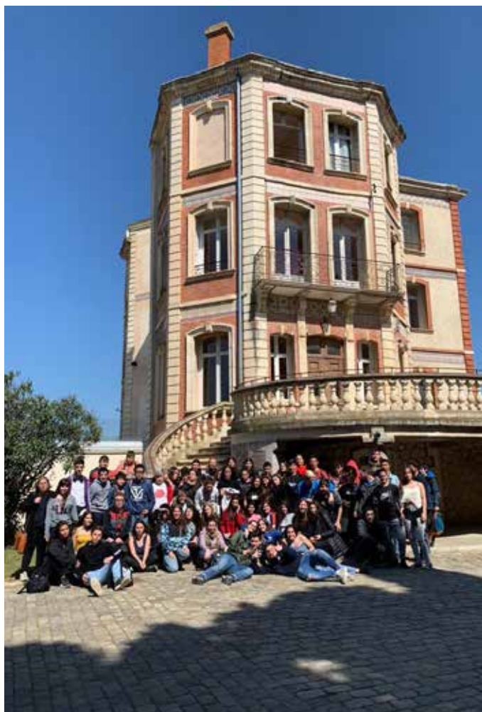
Sortida a la Maternitat d'Elna

La importància de fomentar el sentit de pertinença i reforçar el vincle i l'estimació cap al poble és un dels objectius principals del Projecte Educatiu del nostre institut i, per això, hem continuat apostant perquè la permeabilitat