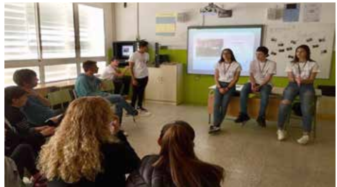
Explicació per part dels mediadors escolars del projecte de convivència i mediació del centre