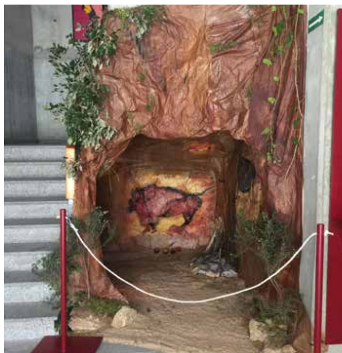
Recreació d'una cova prehistòrica dins del "projecte Homínids"

- Hem sistematitzat les activitats d'autoavaluació i d'auto-regulació com a eina indispensable en l'avaluació formativa, ja que ajuda l'alumnat a ser conscient del moment d'aprenentatge en què es troba i com millorar-lo. Aquest curs, seguint el desplegament de l'Ordre d'Avaluació d'ESO, hem avaluat la Competència Digital i la Personal i Social, i en aquesta darrera també hem inclòs una auto-avaluació de l'alumne.