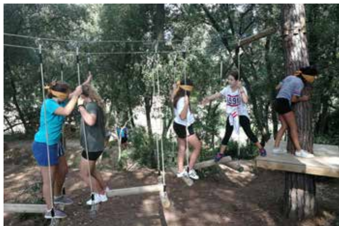
Sortida a la Granja Escola