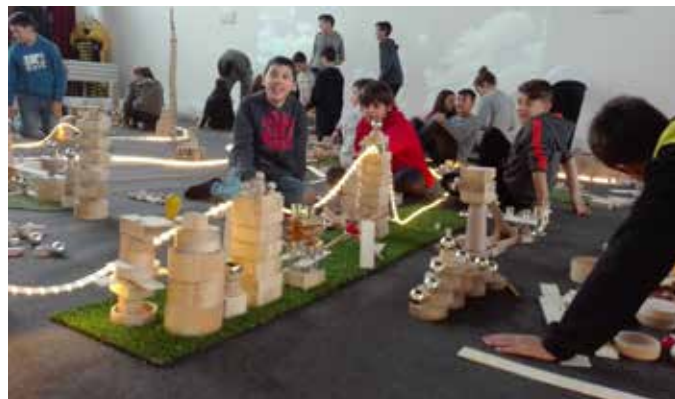
Activitat La Città Infinita