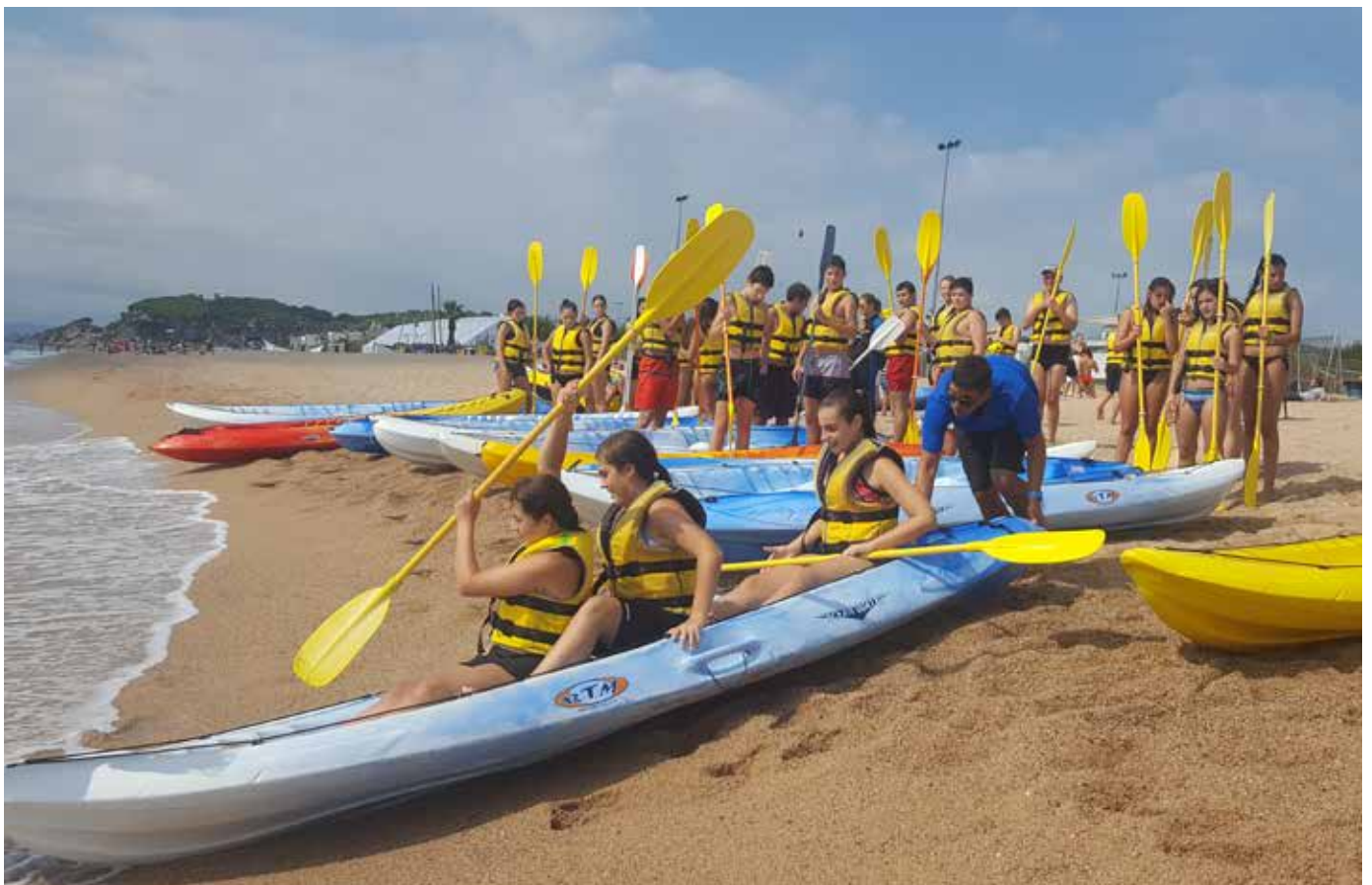
Sortida a la Base Nàutica de Calella