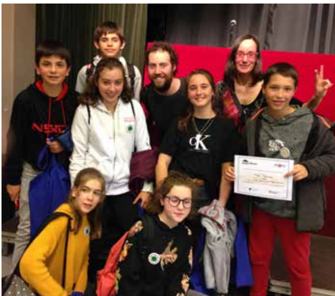
Participants i alumne classificat per a la final del concurs "Fem Mates"

- També impulem activitats en què l'alumnat pren un paper rellevant i s'involucra de manera activa en el seu propi aprenentatge: activitats de matemàtiques i de ciències més manipulatives i vivencials; estudi de les fonts primàries (en col·laboració amb l'Arxiu Municipal) amb diferents treballs de 1r d'ESO i de 4t, que es mostren al públic al juny a la Sala d'Exposicions ; els alumnes de 2n d'ESO fan de guies durant la jornada de portes obertes i mostren a les diferents famílies el treball que l'alumnat ha realitzat al llarg del curs, entre els quals destaca el projecte transversal dels homínids que s'ha dut a terme a 1r d'ESO i s'hi ha treballat des de totes les matèries. L'eix vertebrador del projecte Homínids ha sigut la matèria de socials i, en grups, els alumnes han realitzat l'estudi de 7 homínids, de les eines i materials que empraven i del seu entorn. Des del TIL, català i castellà han redactat les fitxes de cada espècie i des de llengua anglesa han realitzat una presentació oral. A naturals han elaborat una línia del temps i murals amb la fauna de cada període. A música es van crear els instruments (flautes d'ossos). Des de visual i plàstica s'ha recreat una cova amb pintures