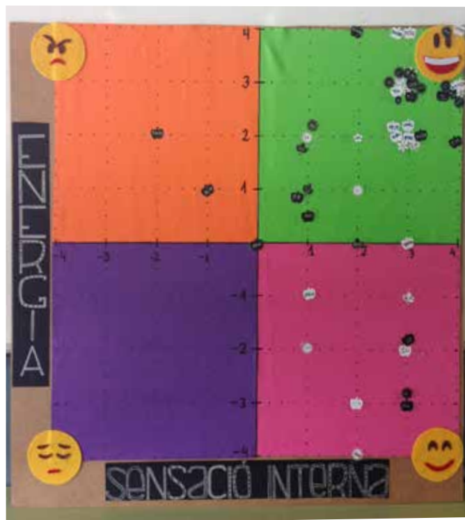
Activitat Mood Meter duta a terme a 2n d'ESO dins el "Projecte Emocional"

Gràcies a tota la comunitat educativa i a les institucions, associacions i empreses d'Arenys de Munt que feu possible dia a dia la millora contínua de l'acció educativa del Perramon! Perquè junts sumem!