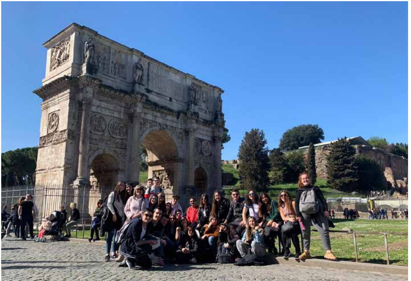
Viatge de final d'estudis de batxillerat a Roma