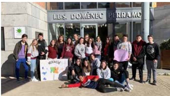
Equip de Mediació 2018-2019

L'equip actualment està format per vint-i-tres persones: vint alumnes, dues professores i la mediadora municipal, que són les encarregades de gestionar els conflictes de forma dialogada i positiva dins el centre i de promoure accions de convivència.