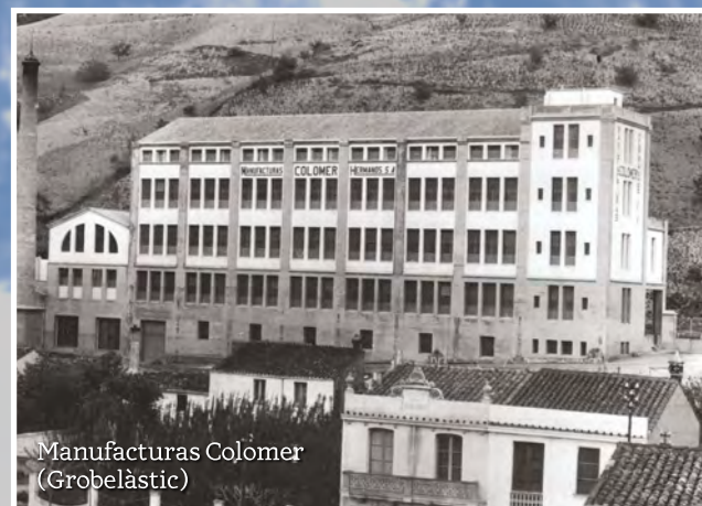
Manufacturas Colómer (Gobelàstic)