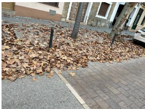
Rambla Francesc Macià

És per aquest motiu que els demanem que facin una intervenció més intensiva i urgent a les vies públiques per tal de retirar la intensa fullaraca que cau dels arbres a fi de garantir la seguretat dels vianants.